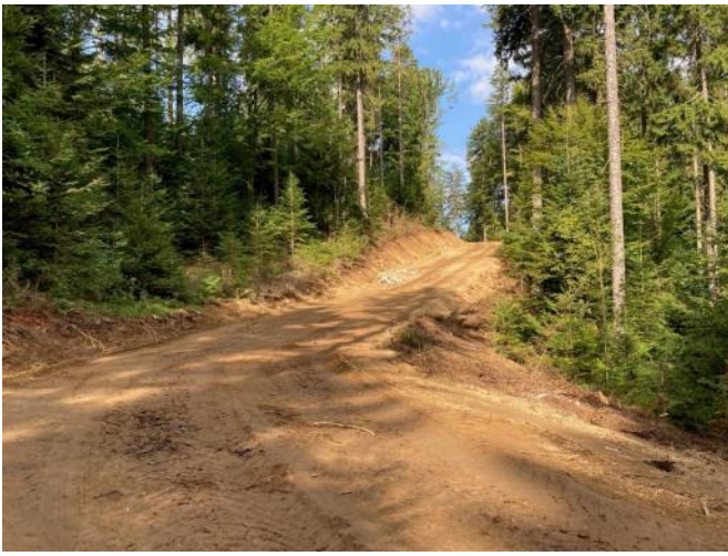
Forststraßenprojekt Mitternschlag in Atzesberg, Rohtrasse vor Aufbringung der Befestigung mit Granitschotter, Fertigstellung September 2023