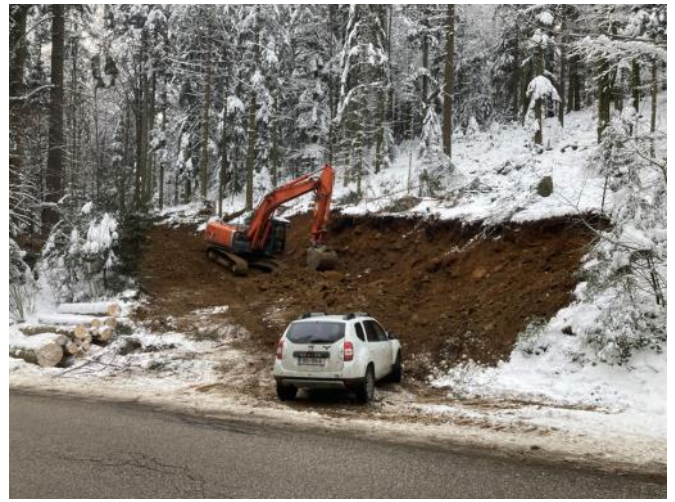
Baubeginn der Forststraße Edtei in Putzleinsdorf im Jänner 2023, Fertigstellung September 2023