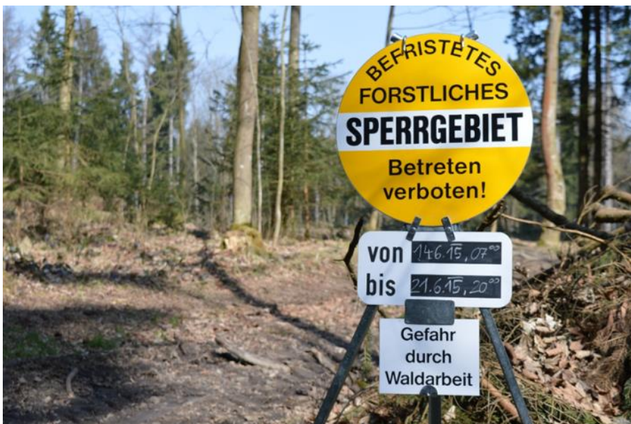
Befristetes Forstliches Sperrgebiet - Waldeigentümer können zum Schutz von Erholungssuchenden während der Holzschlägerungsarbeiten ein befristetes forstliches Sperrgebiet ausweisen.

Wer darf in den Wald und was darf man im Wald machen?