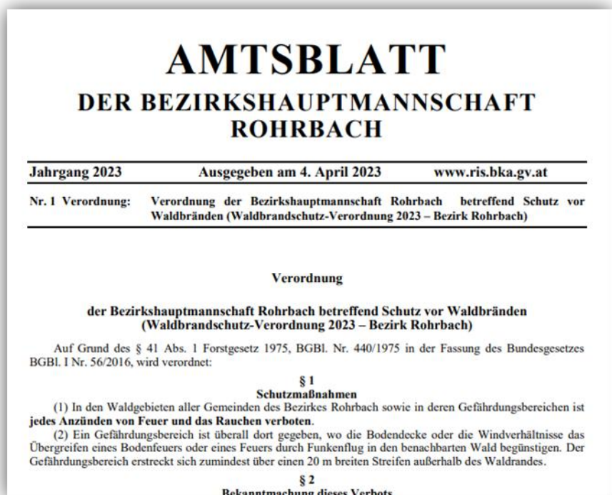
Ausschnitt aus der Rohrbacher Waldbrandschutz-Verordnung 2023

sonders streng geregelt: Feuer darf nur mit einer schriftlichen Erlaubnis des Waldeigentümers entzündet werden. Zigarettenstummel dürfen keinesfalls weggeworfen werden – auch wenn sie nicht mehr glimmen. Je nach Witterung kann die Behörde jegliches Anzünden von Feuer und das Rauchen verbieten. Diese Waldbrandschutz-Maßnahmen wurden heuer aufgrund der Witterung von der Bezirkshauptmannschaft Rohrbach für alle Gemeinden von 4. April bis 31. Oktober 2023 verordnet.